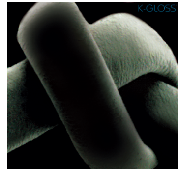
After Two Weeks